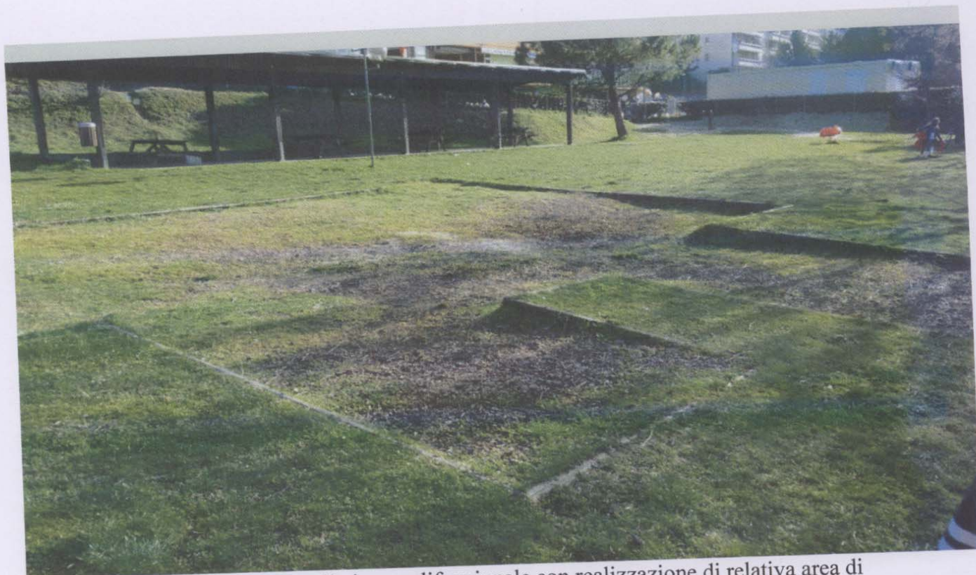
Area indicativa su cui installare il gioco polifunzionale con realizzazione di relativa area di sicurezza