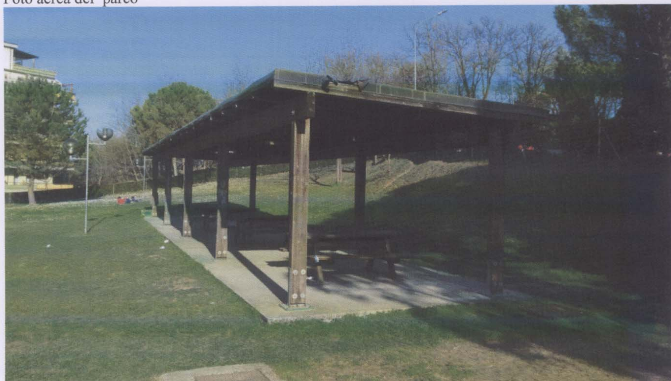
Area di sosta coperta